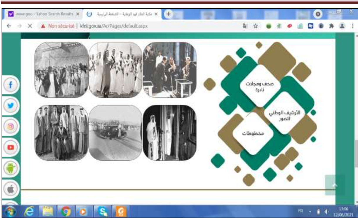
الملحق رقم 01