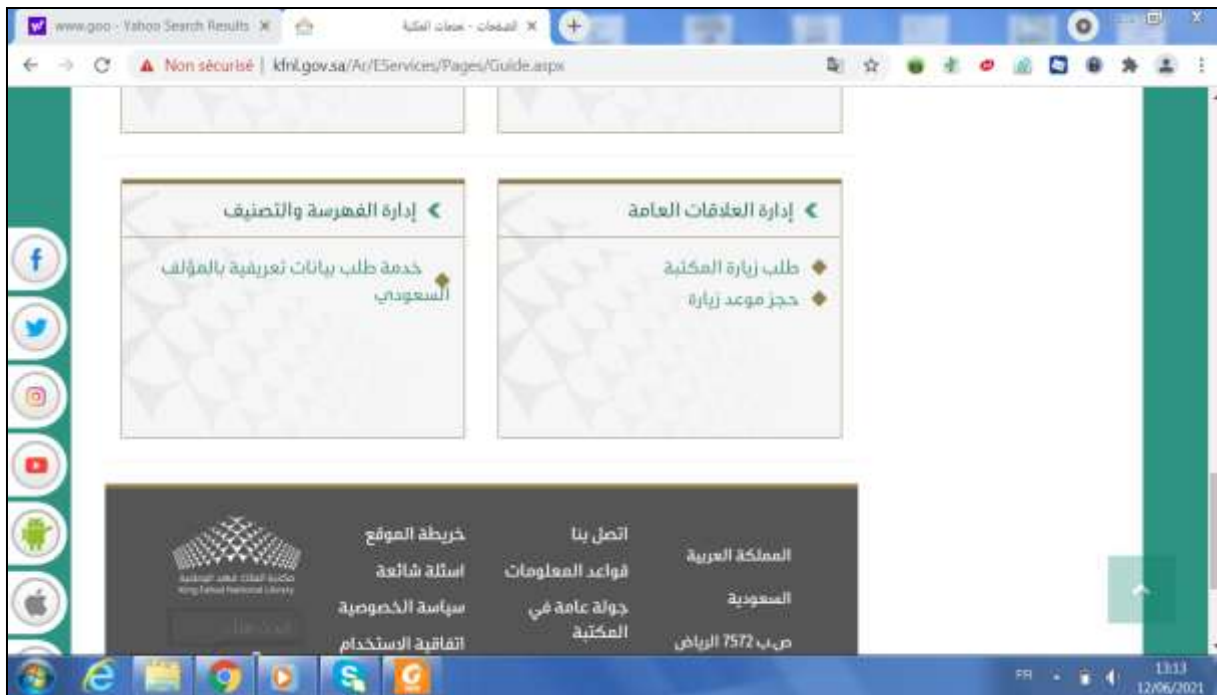
الملحق رقم 11