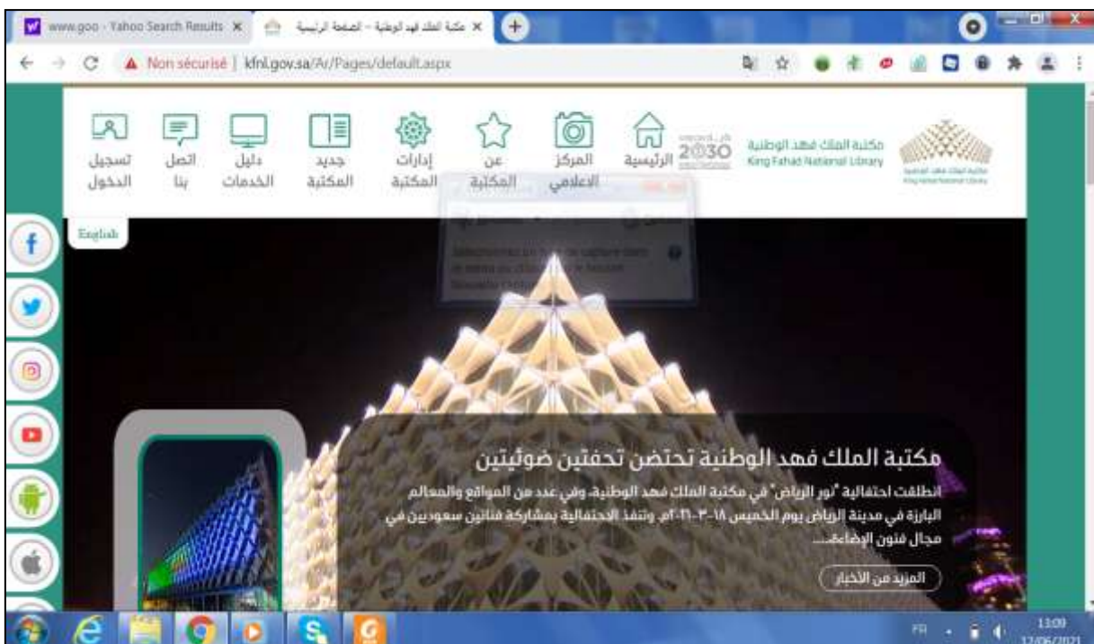
الملحق رقم 06