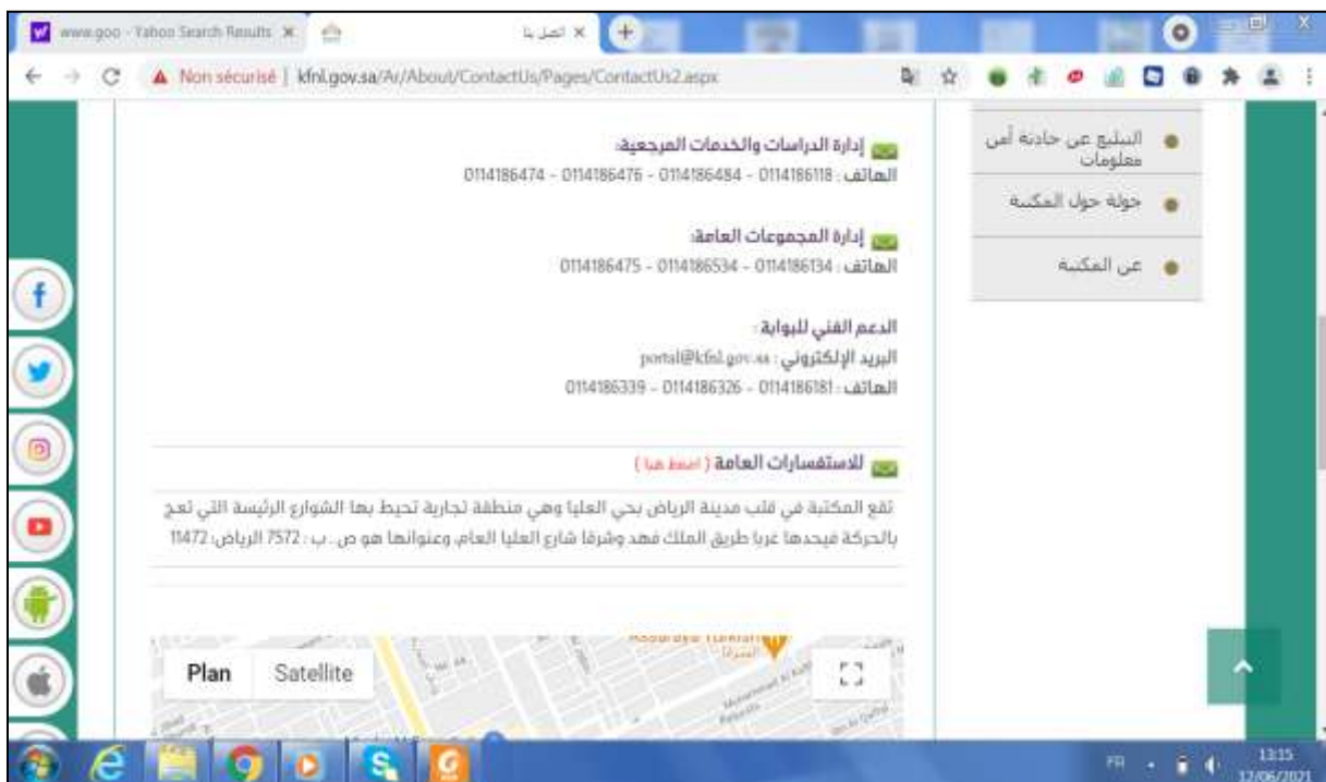
الملحق رقم 12