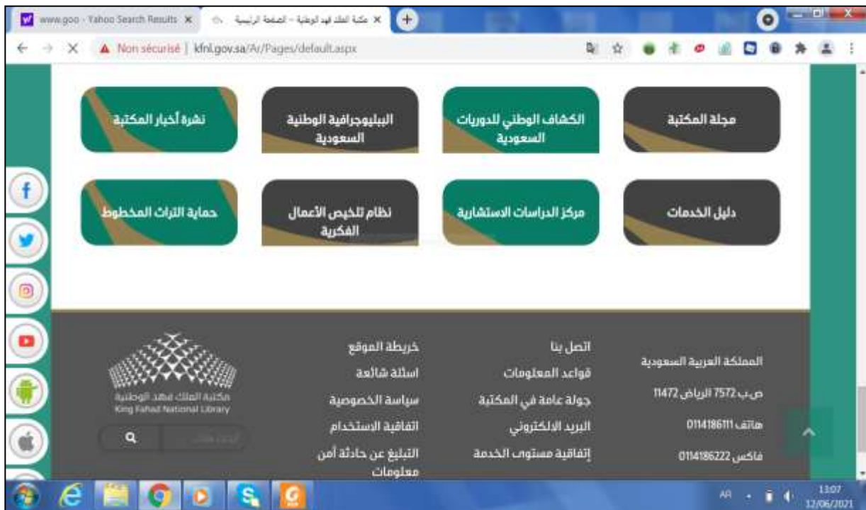
الملحق رقم 02