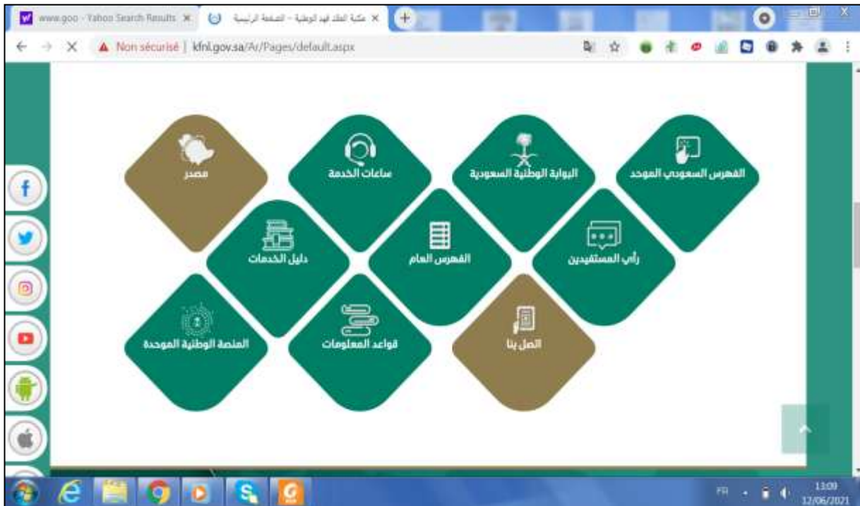
الملحق رقم 05