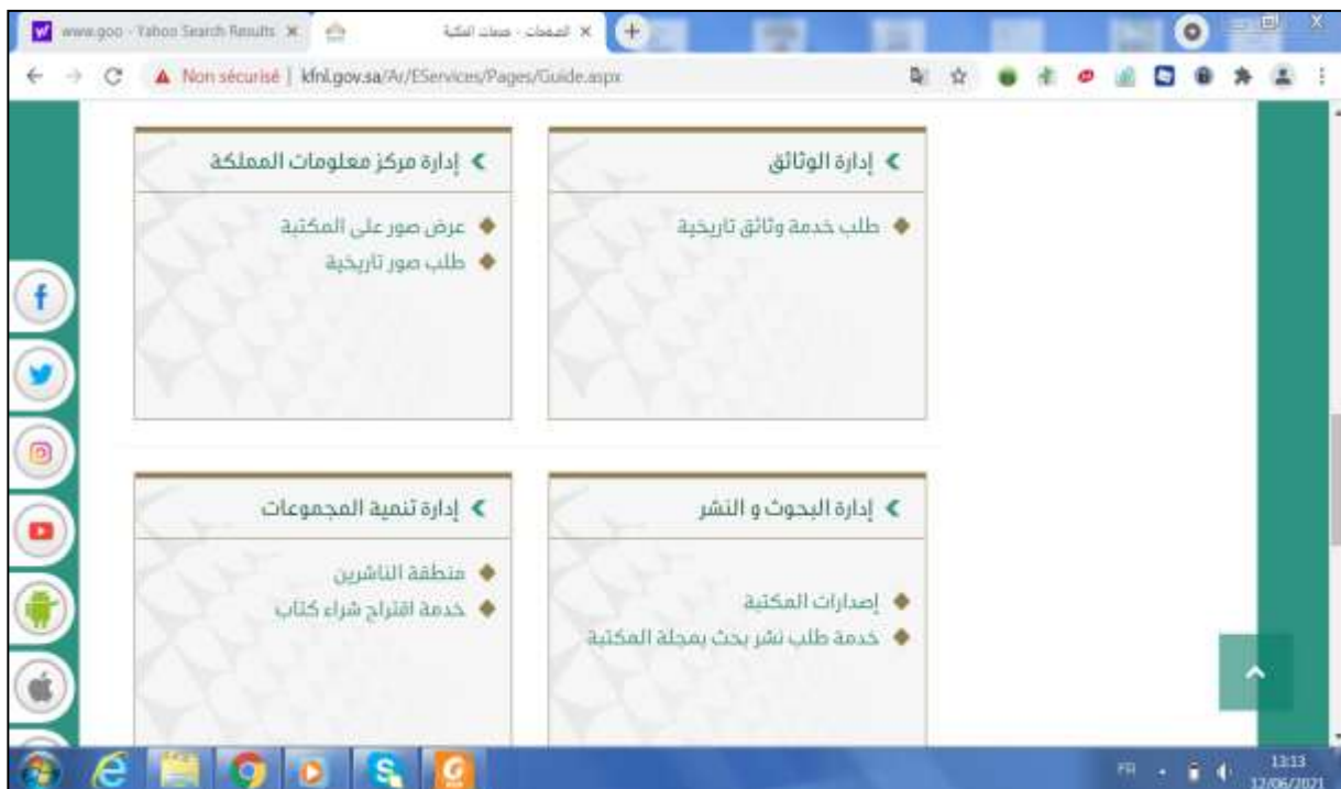
الملحق رقم 10