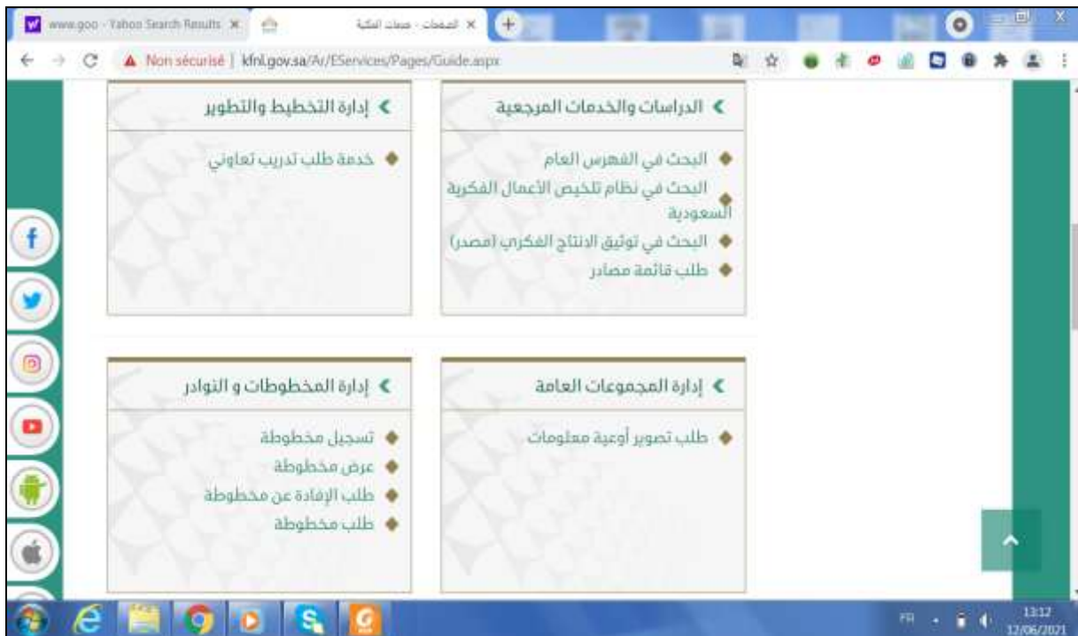
الملحق رقم 09